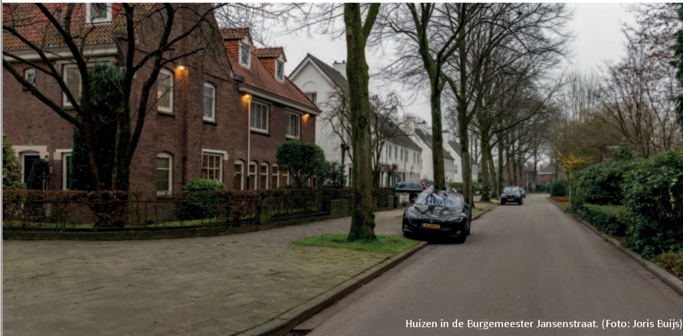
Huizen in de Burgemeester Jansenstraat.

Sinds oktober 2023 regende het uitzonderlijk veel in Tilburg. Daardoor staat het grondwater erg hoog en hadden veel inwoners helaas last van water in hun kelder of kruipruimte. De gemeente liet onderzoeken of de overlast erger werd door de ondergrondse infiltratievoorzieningen (kratten in de grond die water opvangen, red.). Metingen laten zien dat deze voorzieningen amper invloed hebben op de hoge grondwaterstanden.