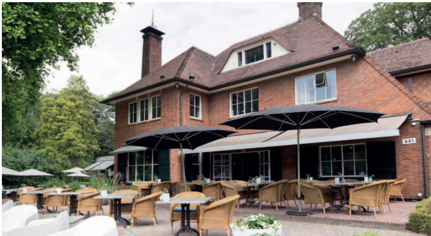
Auberge du Bonheur is prachtig gelegen aan de rand van de Oude Warande.