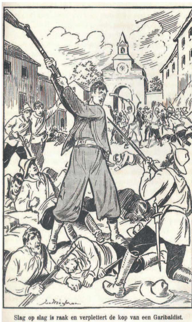
Slag op slag is raak en verplettert de kop van een Garibaldist.