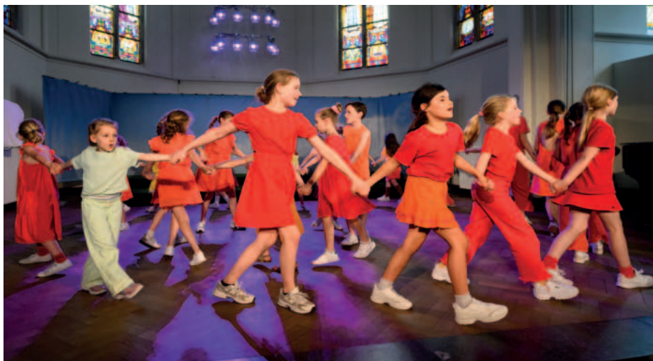
Souvenir Jeugdkoor in actie.

Het Souvenir Jeugdkoor zingt op hoog niveau en wordt zeer regelmatig gevraagd om mee te werken aan projecten van anderen. Zo werken we in 2023 mee aan de Mattheus Passion van het Brabantkoor in de Grote Kerk in Breda en werkten we in 2024 mee aan de jubileumproductie van Philharmonie Zuid-Nederland bij het filmconcert van The Lord of the Rings in de Brabantshallen en Ahoy. Ook worden we gevraagd voor verschillende opnames. Zo hebben we eigentijdse Sinterklaasliedjes opgenomen die te zien zijn op Spotify en hebben we